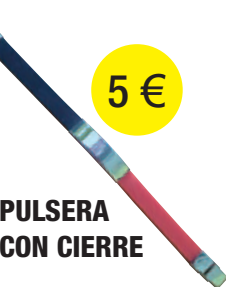
PULSERA CON CIERRE 5 €