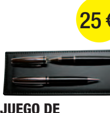
JUEGO DE BOLÍGRAFOS 25 €