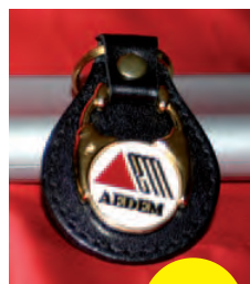
LLAVERO 3 €