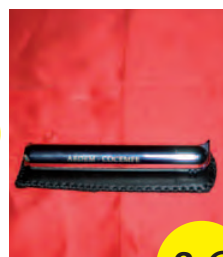
MECHERO CON FUNDA 6 €