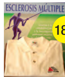
POLO BLANCO 18 €