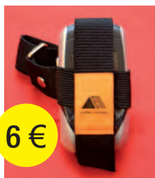
MUÑEQUERA PARA MÓVIL 6 €