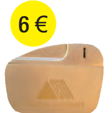
ENCENDEDOR 6 €