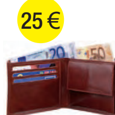
CARTERA 25 €