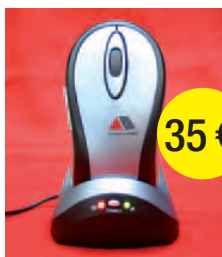
RATÓN INALÁMBRICO 35 €